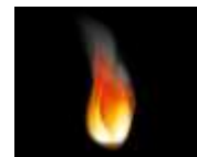
Le compagnon du Silence

« Au moment où Abd-ru-shin donnait forme à Son Message, la femme de l'époque, comme chacun peut le voir sur les photos et vidéos est, comparée aux femmes d'aujourd'hui « si bien vêtue ». Malgré cette apparence, l'auteur nous fait savoir qu'elle est impudique et vulgaire. Femme en toute sincérité, regarde-toi avec la froideur sévère de la Pureté et sans ménagement ni flatterie envers tes caprices, retourne rapidement sur le Terrain de la véritable Féminité en tant que Gardienne de la Flamme de l'aspiration sacrée ! »